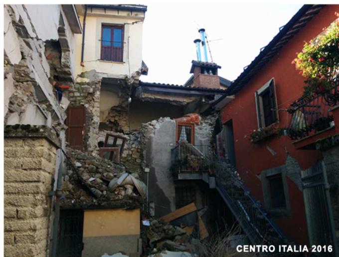
CENTRO ITALIA 2016

Il convegno vuole affrontare gli aspetti pratici legati alle agevolazioni fiscali del cosiddetto sismabonus per gli interventi di miglioramento sismico sugli edifici esistenti.